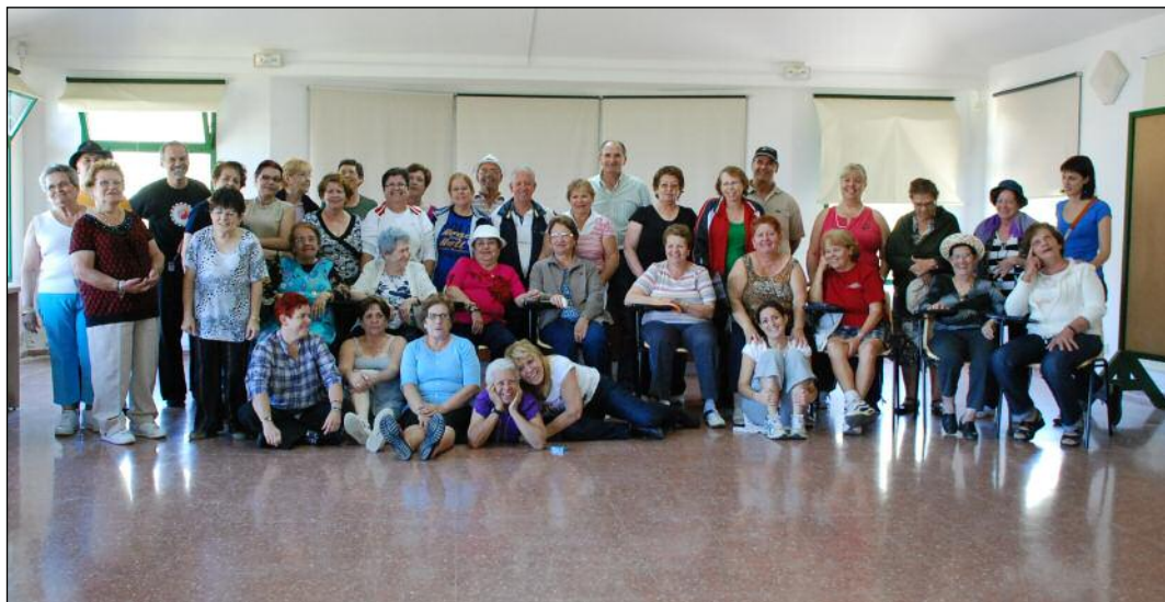
En el Aula de Naturaleza trabajaron la autonomía personal. Abajo, preparados para la caminata.

Por otra parte la Concejalía ha visto superadas las expectativas de participación en el programa de caminatas y senderismo para mayores, en una de las cuales recorrieron los caminos de la presa de Chira y Cercados de Araña acompañados por un guía.