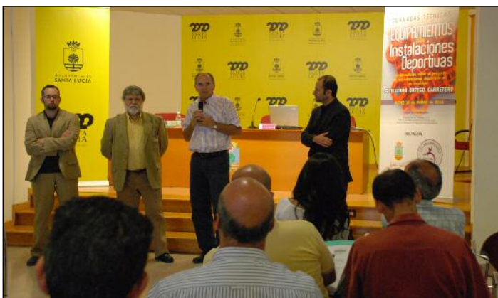
Gestores deportivos. La Asociación Canaria de Gestores Deportivos, Acagede, celebró en el municipio unas jornadas para analizar las técnicas de equipamientos para instalaciones deportivas y su desarrollo en el ámbito municipal.

El grupo subraya en su propuesta que "en el caso específico de Santa Lucía, la modificación del Catálogo de Especies Amenazadas de Canarias podría afectar a especies de flora en peligro de extinción, como la siempreviva, el pimentero, el chaparro y el balancón, así como especies avícolas como el chorlito patinegro, del que sólo consta una pareja en Tenefé".