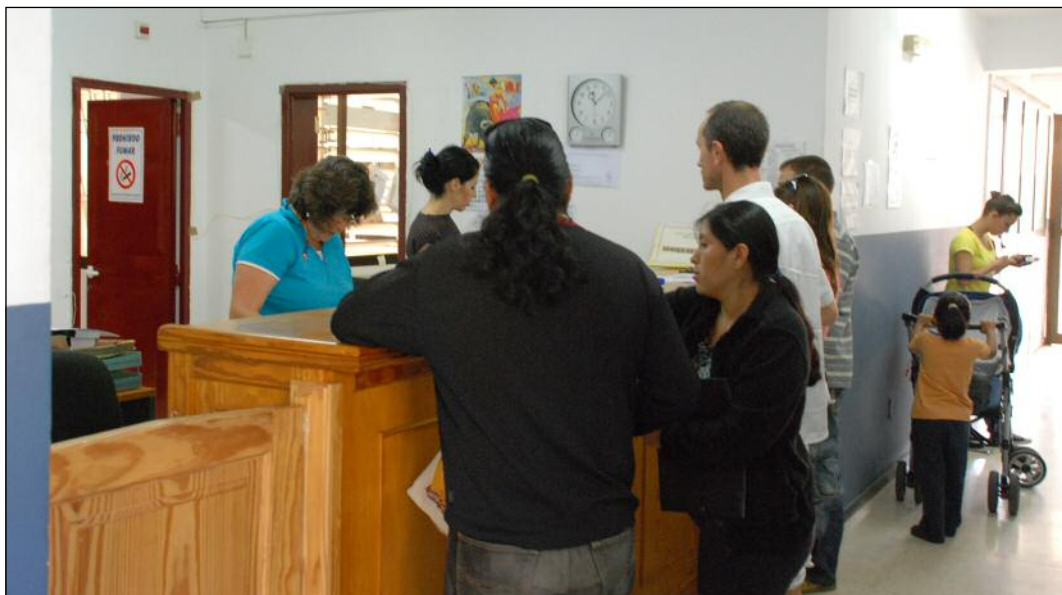
El trabajo aumenta cada vez más en el Juzgado de Paz mientras el Gobierno recorta sus aportaciones.