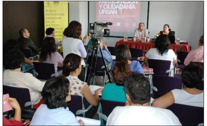
La segunda charla-taller se celebró en el IES Gran Canaria.