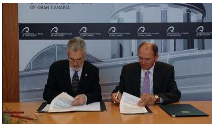
El rector y el alcalde en la firma del convenio celebrada en la ULPGC