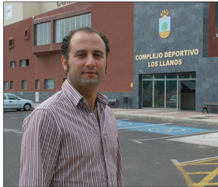
El concejal de Deportes, ante el Complejo Deportivo de Los Llanos.