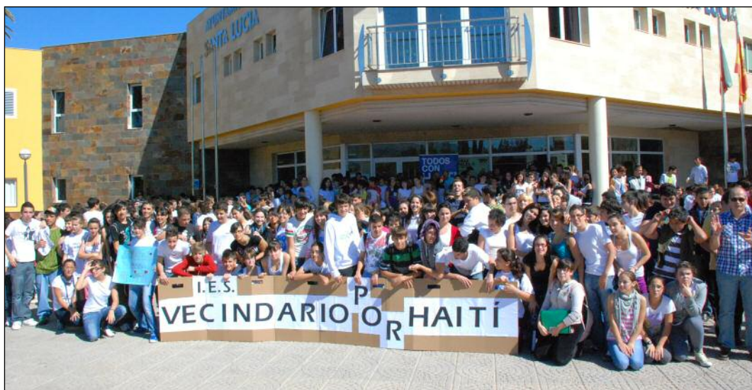
Más de 400 alumnos/as del IES Vecindario se acercaron al Ayuntamiento para entregar su aportación.

En el acuerdo corporativo, presentado al pleno por el grupo de Gobierno municipal y suscrito por la totalidad de las fuerzas políticas, se afirma que "la pobreza y el hambre son el principal problema que tiene la humanidad y por eso recordamos que en el año 2000 una declaración por la que la comunidad internacional se comprometió, entre otros objetivos, a erradicar la pobreza extrema y el hambre en el mundo antes del año 2015".