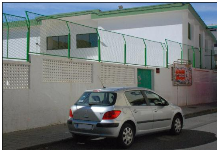
La antigua escuela de Pío X no cubre ya las necesidades del centro.

La parcela está situada en la calle Trebolina, de El Canario, y forma parte de los 15.000 metros cuadrados del patrimonio municipal denominado terreno en el Plan Parcial El Canario. Los 2.000 metros cuadrados que se ceden están calificados como de uso educativo.