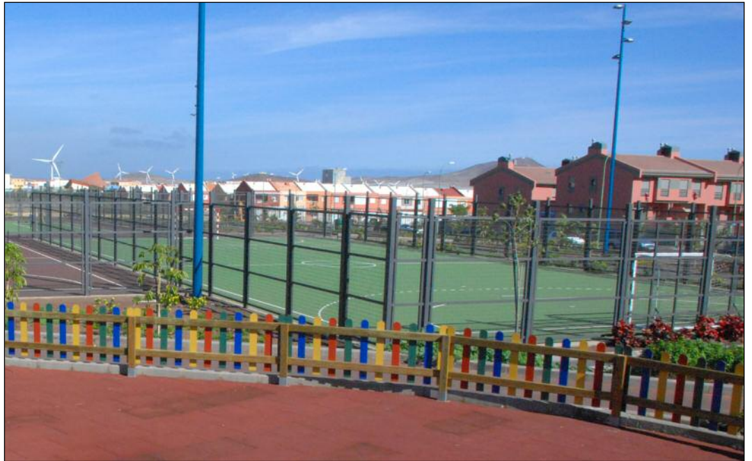
Las amplias instalaciones responden a la demanda de la población de una zona en crecimiento.

La amplia parcela dispone de cuatro canchas polideportivas dotadas de alumbrado y valla perimetral, un parque infantil equipado con juegos y solado de seguridad, así como con zonas verdes y pasillos de acceso. La nueva infraestructura de ocio y deportiva, que salió a licitación por un montante total de 600.000 euros, está situada en una zona muy céntrica.