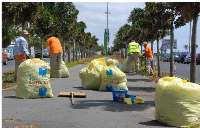
Una propuesta incluye un plan de limpieza y mejora del paisaje.

También se pretende implantar la red wifi en diversas zonas del municipio, así como ampliar el centro de proceso de datos, actualizar los servidores críticos, hacer una replicación de seguridad de las bases de datos y digitalizar los documentos de entrada de la Oficina de