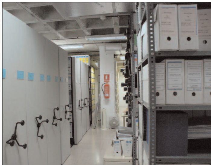
El plan adaptará el archivo a las exigencias de la e-Administración.

Este nuevo esfuerzo por la modernización del nuevo archivo municipal está ligado al proyecto de adaptación e implantación de la e-Administración o Administración Electrónica que ofrecen las nuevas tecnologías y cuyo fin es el de facilitar el acceso electrónico de los ciudadanos a los servicios que presta la institución municipal.