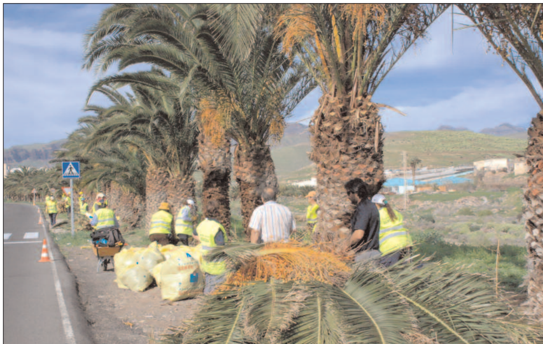
Un grupo de trabajadores y trabajadoras contratados por estos convenios, en el palmeral de la GC-500.

El 25 de este mes se celebran en el Hotel Avenida de Canarias las VIII Jornadas Técnicas Municipales de Emergencias y Catástrofes, organizadas por la Concejalía de Seguridad Ciudadana a través de la Oficina de Prevención y Seguridad Pública, sita en el antiguo Ateneo, donde está abierto el plazo de inscripción.